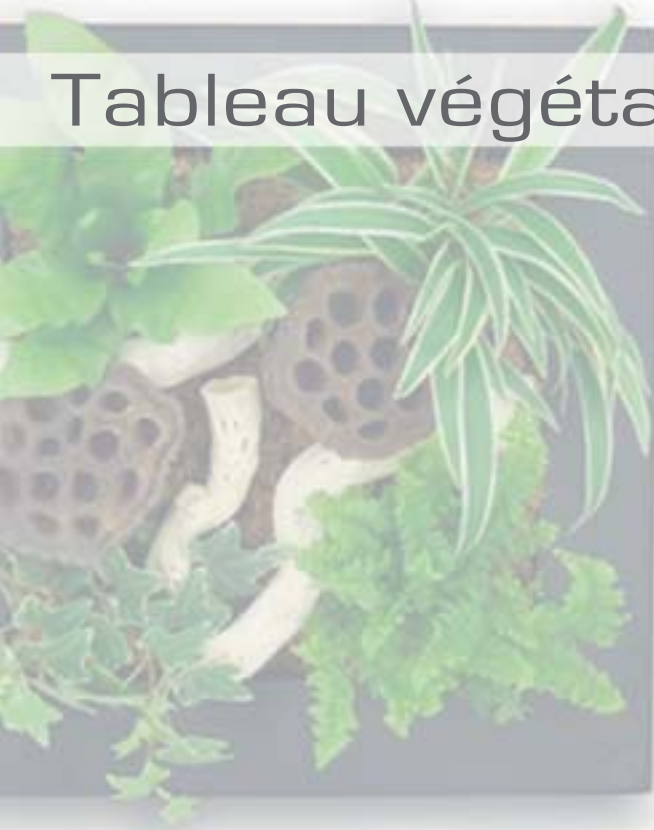
Tableau végétal : Conseils d'entretien

Le cadre végétal contient un substrat absorbant agissant comme une éponge. Ce substrat retient l'eau d'arrosage puis la restitue progressivement aux plantes